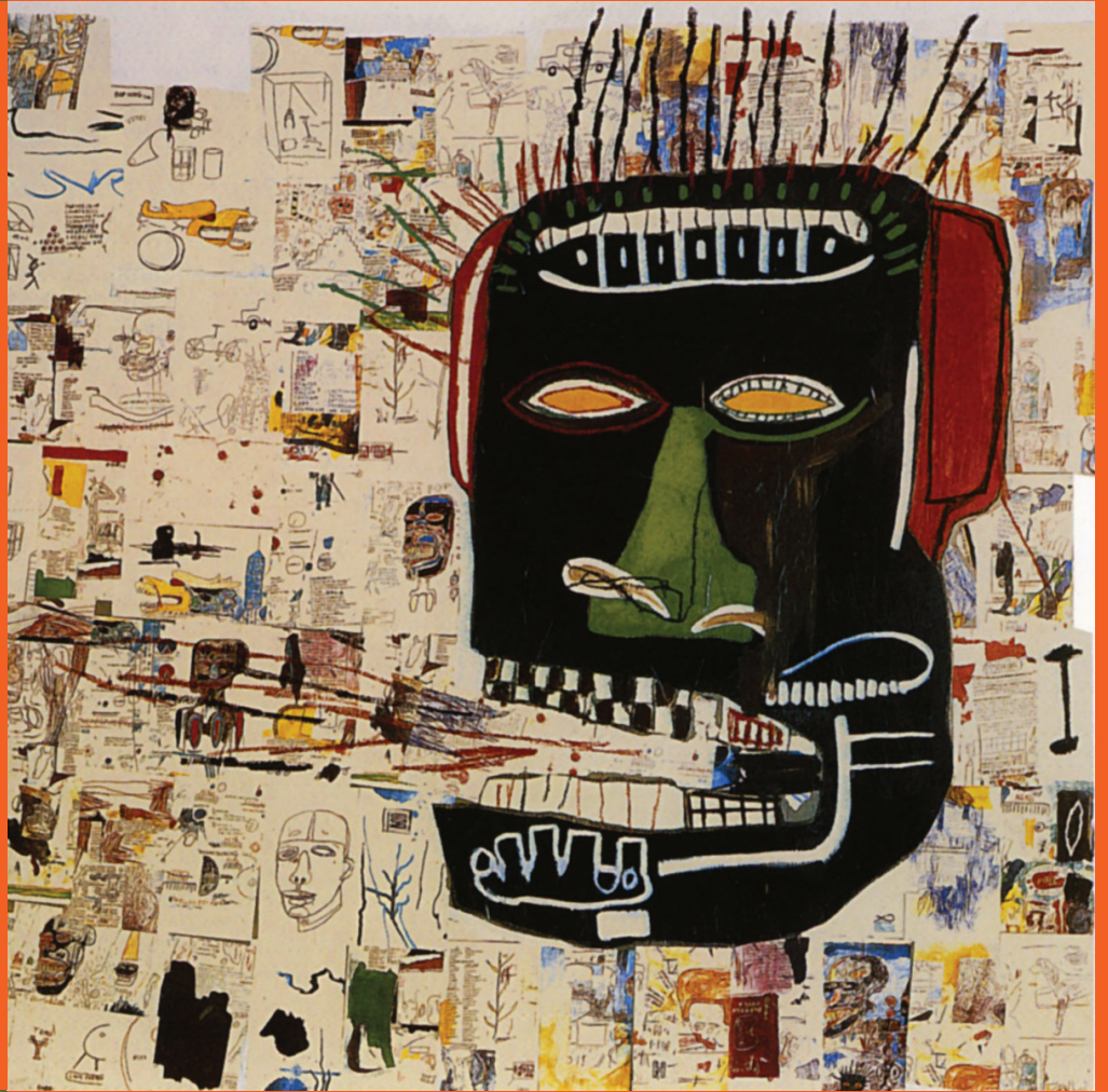
Jean - Michel Basquiat. Glenn. 1985